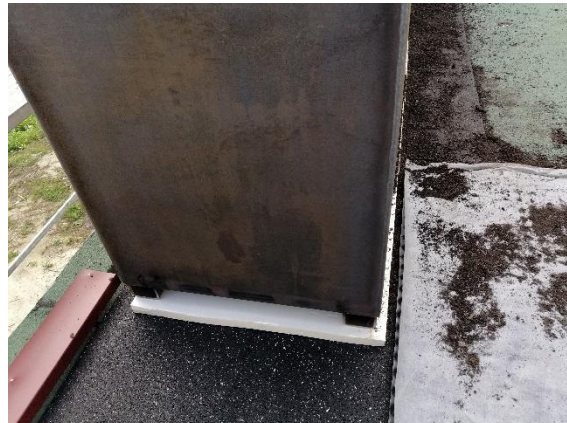
Hochbeet mit Füßen, so dass das Wasser gut abfließt