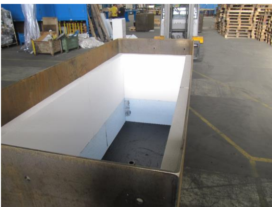
Isolation unten für Wassertank oben für Kälte und Wärme

Hochbeete nach Mass, für Gärten Terrassen und Flachdächer. Winter fest mit Isolation und Wassertank. Wenn diese verbunden werden, können Sie auch für Terrassen und Flachdächer an Stelle von Geländer verwendet werden.